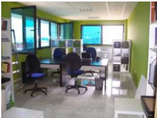
El color verde es generador de ideas en un ámbito creativo