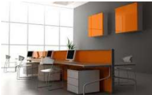
Los paneles divisorios pueden agregar el yang