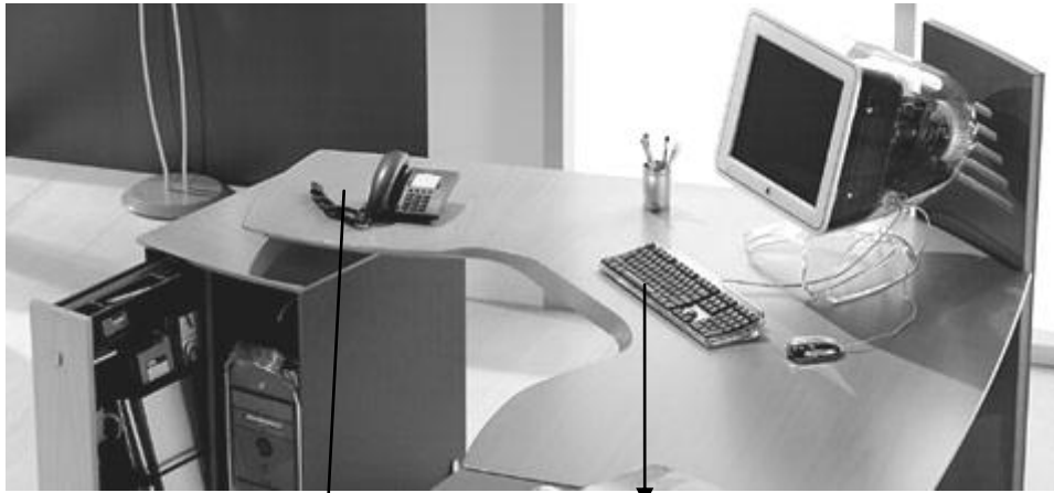
HABLAR POR TELEFONO

Hablar por teléfono y mirara la pantalla hacia una buena orientación