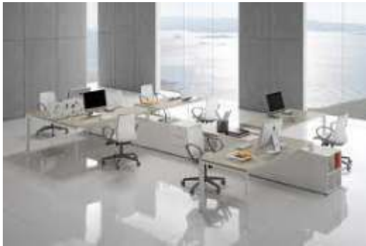
El blanco genera individualismo

Una oficina totalmente blanco puede traer discusiones e individualismos